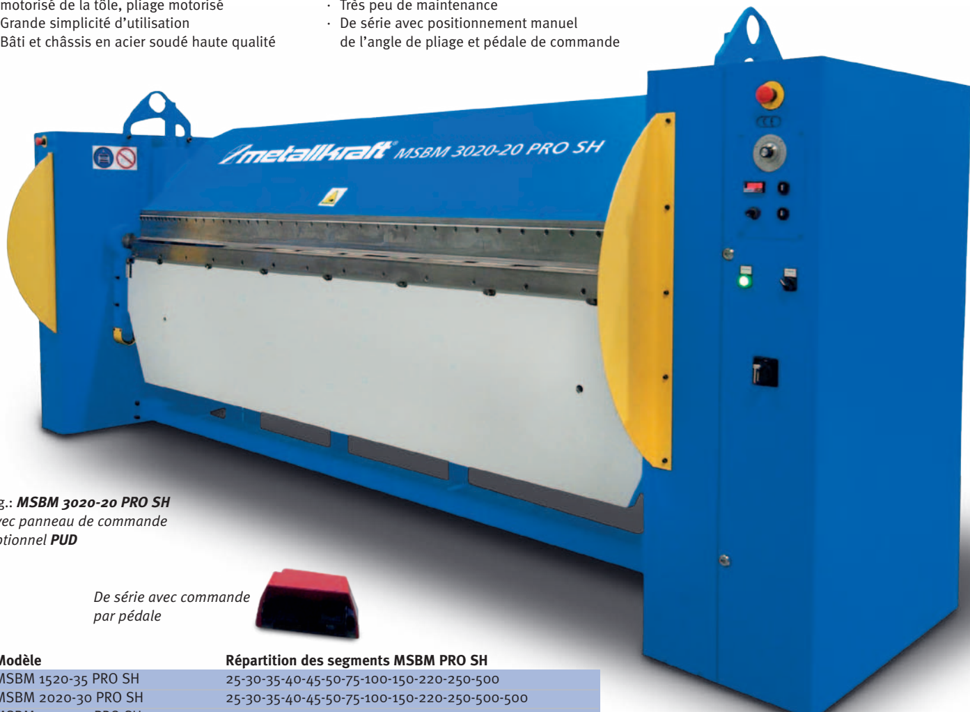
Fig.: MSBM 3020-20 PRO SH avec panneau de commande optionnel PUD