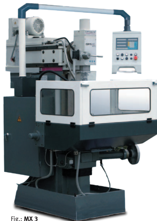
Fig.: MX 3