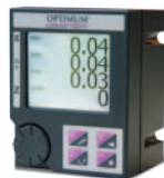
Fig.: TU 2506

Kit d'adaptation CNC disponible : voir page 214